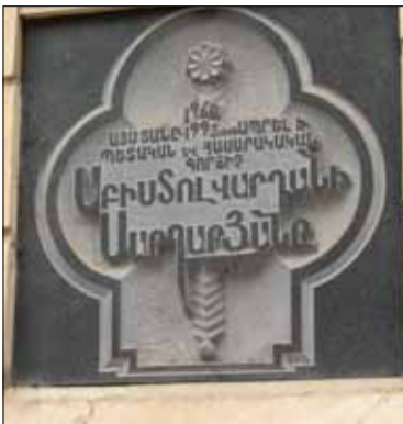
Կապանի Արամ Մանուկյան 1 շենքի ճակատին փակցված հուշատախտակը, որը վկայում է Ա.Սարգարյանի՝ այդ շենքում 1960-ից բնակվելու մասին:

պահպանության եւ գյուղաշխարհի մարդկանց օգտակարության: Ժամանակի ընթացքում նա ստացել է «Ջակոն Վարդանիշ» բնորոշումը՝ որպես օրինակականությանը հավատարիմ պահպան: Կապան աշխարհի պատմության մեջ կմնա որպես ուղի հարթող ղեկավար, նախագահ: Հանրապետական կարգի անհատական կենսաթոշակառու դառնալուց հետո էլ շարունակել է պետական եւ հասարակական արգասավոր գործունեությունը որպես Կապանի շրջապատ ընկերության նախագահ, իսկ 1975-1985թթ. Կապանի ինֆորմացիոն հաշվողական կայանի պետ էր: Վետերանների խորհրդի նախագահ Աշոտ Գովհաննիսյանը պնդում էր, որ Արխսու Սարգարյանը կա-