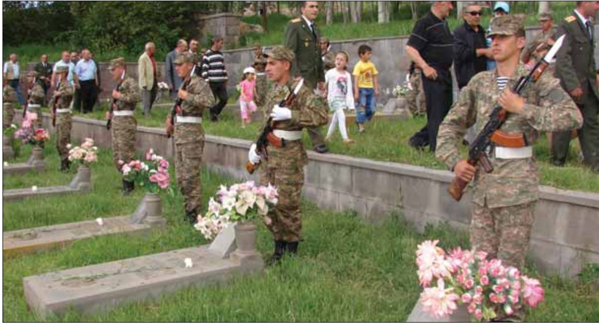
28.05.2012թ., Արցախյան պատերազմում զոհված սիսիանցիների պանթեոնում: