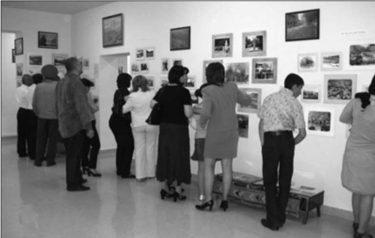
19.05.2012թ. «Թանգարանային գիշեր» միջոցառման ժամանակ:

Թանգարանների միջազգային օրվա առթիվ մի քանի տարի է, ինչ մեզանում կազմակերպվում է «Թանգարանային գիշեր» միջոցառումների շարքը: Այս անգամ այն անկացվեց «Գիրք փոփոխվող աշխարհում» խորագրի ներքո՝ մայիսի 19-ին: