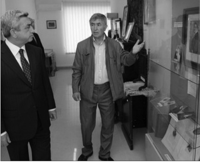
17.04.2012թ. Թանգարան էր այցելել ԶԳՆ Խախատակ Սերժ Սարգսյանը: